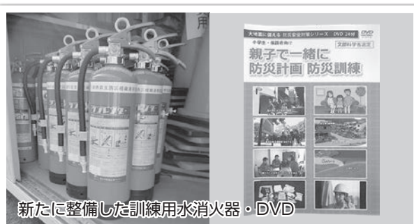
新たに整備した訓練用水消火器・DVD