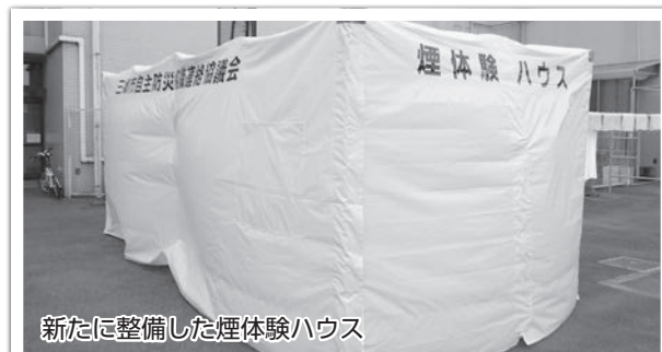
新たに整備した煙体験ハウス