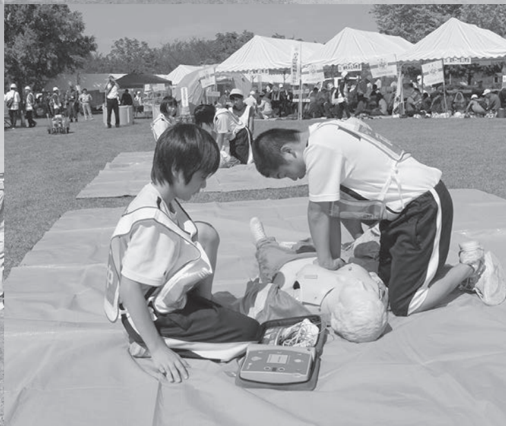
過去に実施した三郷市総合防災訓練の様子